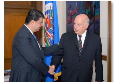
El Ministro de Seguridad, Mario Zamora ; comparte con el Secretario General de la OEA, José Miguel Insulza .

Además, ratificó el compromiso de Costa Rica con el diálogo político para analizar el problema de las drogas en todas sus variables sociales, políticas y económicas, y buscar así, la mejor forma para enfrentarlo.